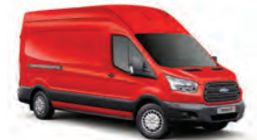
COLORADO RED - 4A7