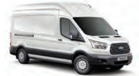
BLANCO OXFORD - 3GZ