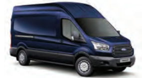
AZUL BÁLTICO - 3JV