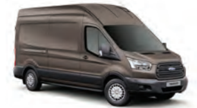
MARRÓN BRISBANE - 4AR